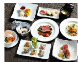
←お料理はすべて自社厨房で作っています ※調理スタッフも募集あり

★先輩社員より 冠婚葬祭のあり方は時代によって変化があり、お客様の希望もいつも同じではありません。私たちは常にお客様のニーズにアンテナを張り、寄り添う気持ちを持って働いています。そうすれば例えば葬儀は悲しいものではなく「無事に故人を見送れた」とみんなが納得し、私たちの仕事は喜ばれるものになるのです。「ありがとう」と言われるたびにやりがいを感じ人間的に成長できる、そんな充実感のある仕事です。